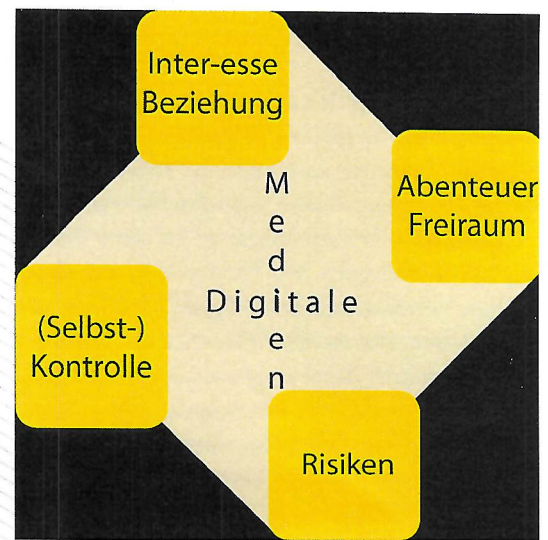
Digitale Medien und Jugend: ein Spannungsfeld mit vielen Chancen und Risiken

Das unbestimmte „irgendw...“ bezeichnet die Vielfalt der Möglichkeiten und zugleich die Verunsicherung, die uns in Sachen Digitalisierung umtreibt, wenn wir kritisch darüber nachdenken. Diese unsichtbare Macht lässt quasi beiläufig, aber zwangsweise einen digitalen Schatten der eigenen Person entstehen, dem wir uns nicht entziehen können. Wir können diese unsichtbare Macht aber auch nicht (be-)greifen. Begreifen wäre